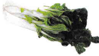
la bette la blette