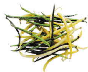
le haricot vert