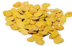
la fève sèche