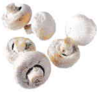
le champignon de Paris