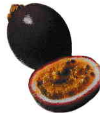
le fruit de la passion