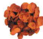
le raisin sec