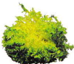
la chicorée frisée