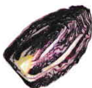
la chicorée trévise