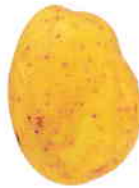
la pomme de terre