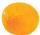
la mandarine la clémentine