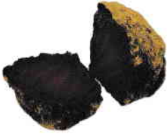
la betterave rouge