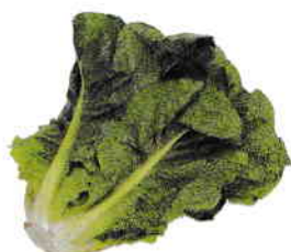
la laitue romaine