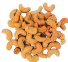
la noix de cajou l'anacarde