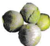
le chou de Bruxelles