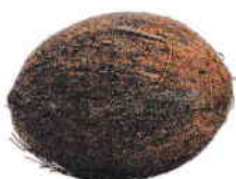
la noix de coco