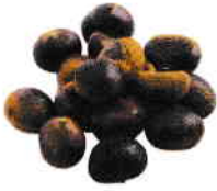
la châtaigne le marron