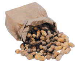
l'arachide la cacahuète