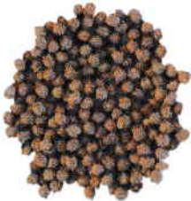
le pois chiche