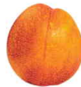
la nectarine le brugnon